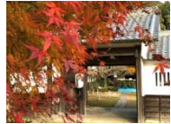
旧柳生藩家老屋敷

キーワードラリー キーワード設置場所 (答えてメイン会場で 季節の汁プレゼント)