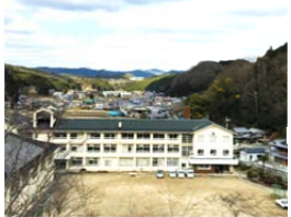
旧柳生中学校 (メイン会場/駐車場) 16日・17日

インフォメーション 16・17日 旧柳生中学校内 上記以外 13-20日 旧JA柳生マーケットに設置